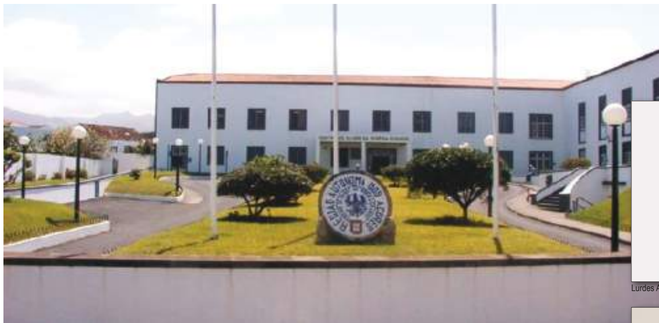
Centro de Saúde da Ribeira Grande