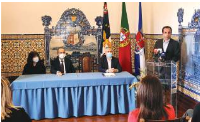
Haverá alguns momentos altos nestas comemorações dos 500 anos de Gaspar Frutuoso

As comemorações continuam no mês de junho com um momento alto relacionado com o feriado municipal da Ribeira Grande. Inserido nesse programa de comemorações do feriado municipal, será lançado o roteiro físico e virtual de Gaspar Frutuoso na Ribeira Grande. “Isto porque existem diversas memórias quinhentistas na Ribeira Grande e que podem ser aspetos arquitetónicos, aspetos gráficos até e que constituíram depois o roteiro daquilo que Gaspar Frutuoso fazia alusão nos seus livros, nos seus