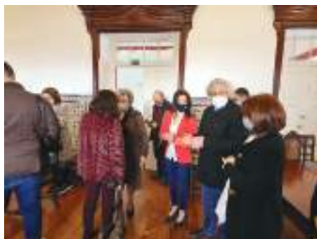
Será um ano de comemorações

escritos, que se situavam aqui, na cidade de Ribeira Grande”, explicou o vereador.