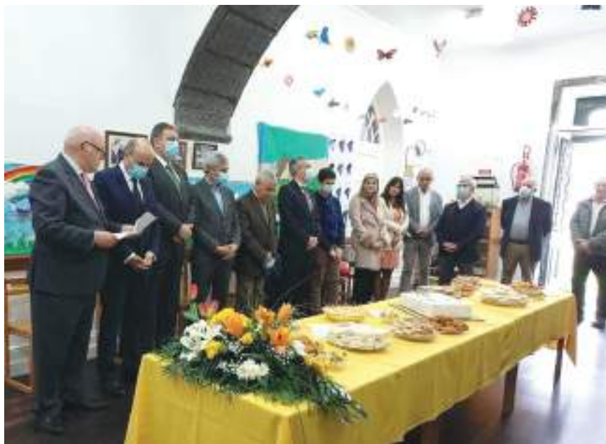
Sessão comemorativa dos 55 anos da Casa do Povo da Ribeira Grande