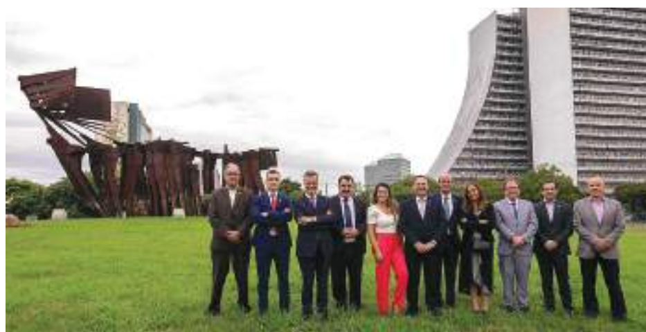
Comitiva da Região Autónoma dos Açores participou no desterro da placa comemorativa dos 250 anos da fundação de Porto Alegre