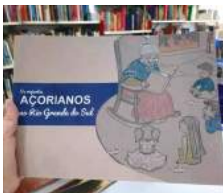
A cartilha infantil editada pela Casa dos Açores do Rio Grande do Sul com o apoio da Direção Regional das Comunidades