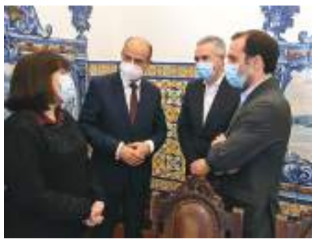
As personalidades presentes